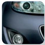
Metropolitan Grey Mica* (36C)