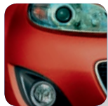
True Red (A4A)