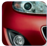
Copper Red Mica* (32V)