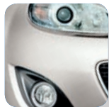
Crystal White Pearl Mica* (34K)