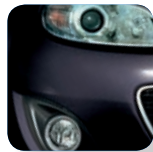
Brilliant Black (A3F)