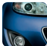
Stormy Blue Mica* (35J)