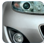
Aluminium Metallic* (38P)